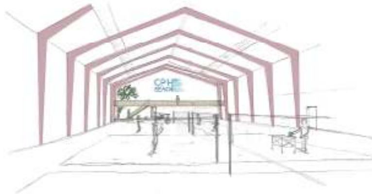
Hallen indefra set fra syd væggen. (Skitsetegning af arkitekt Elisabeth Sommerlund)

Beacharenaen tiltænkes opbygget med et mindre opholdsareal, samt sand på den resterende del af området.